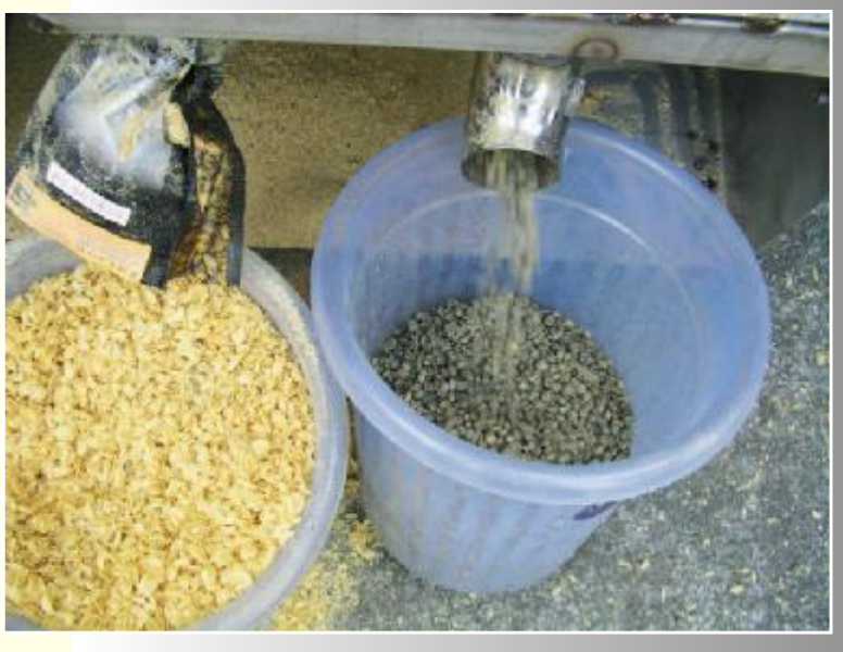
◆咖啡豆從種植到消費者口中，可是得經過重重步驟，才可有一杯好喝的古坑咖啡。

要喝一杯香醇回甘的咖啡，很簡單，要煮咖啡之前再研磨咖啡豆，因為，剛研磨好的咖啡豆最香，煮出來的咖啡也最有味道，如果用喝美式咖啡，豆子要研細一點，如果是採沙漏式，咖啡豆要粗一點，如果要喝濃一點的咖啡，咖啡則要煮久一點！