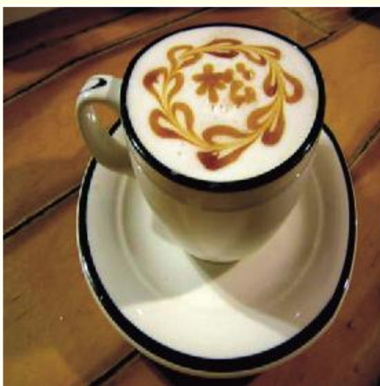
◆古坑的咖啡豆煮出來的咖啡，香味迷人，光看就感動。

華山的地型適合休閒旅遊，又不收門票，庭園咖啡50幾家，小攤販200多家，民宿60幾家，每逢假日到處都有免費試吃試喝活動，常常聽到遊客笑說：拿一枝牙籤就可以在華山吃一頓飯。川流不息的人潮，為商家帶來不少的商機，當地阿公阿婆把樹下種的蔬菜拿來賣，應時的水果攤時時出現，走過街上不時傳來商家的吆喝聲，宏亮有精神的叫賣聲有時比車子的引擎聲還大聲！