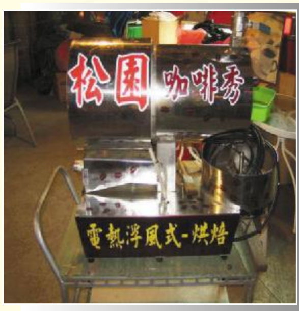
◆不具苦澀味的好咖啡，就是靠熱風式咖啡烘培機所烘培出來的。

每個人對自己的生長地都懷有特殊的情感，也希望為土生土長的所在地盡一份心力，參與黑金山傳奇的咖啡店、民宿的業主及咖啡農們，深深的體驗到咖啡文化在華山的影響力，也相信只要和咖啡有關的產品都會熱銷，憑藉著這股信念，大家持續研發咖啡相關的產品及設備，並且透過網路行銷和