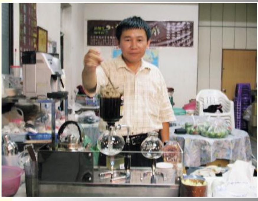
◆林茂成煮起咖啡，一點都不輸給國際專業級。

此並不是所有的店家同時加入。不過今年七月才開張的華芳名宿，居然第一週就有人利用電子郵件來尋問房價的問題，但是劉老闆連電腦開機都有問題了，如何回信呢？